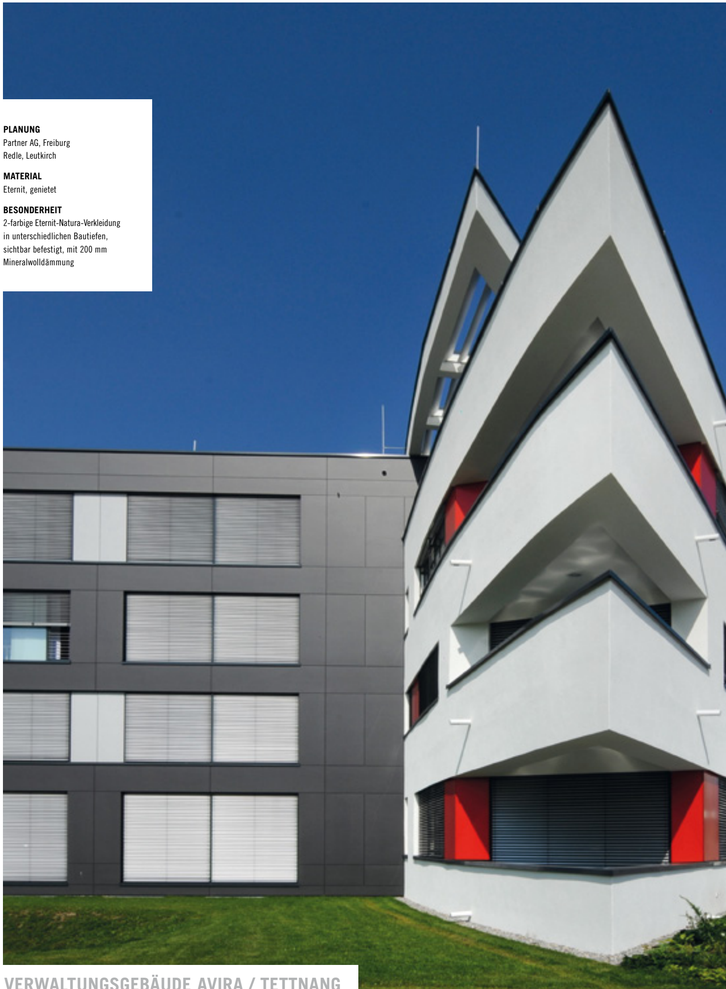
VERWALTUNGSGEBÄUDE AVIRA / TETTANG

2-farbige Eternit-Natura-Verkleidung in unterschiedlichen Bautiefen, sichtbar befestigt, mit 200 mm Mineralwolldämmung